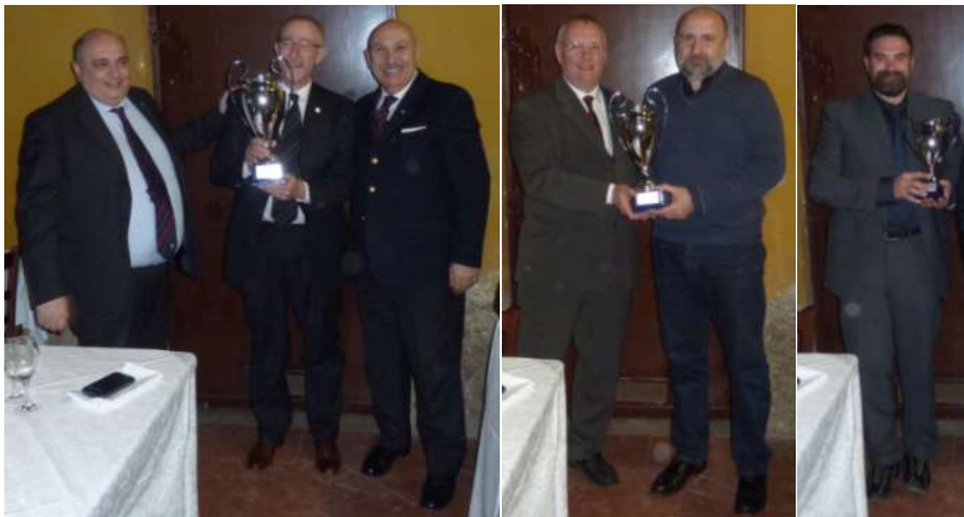
Da sinistra a destra le foto dei premiati dal 1° al 3° posto. Sotto la miglior squadra estera, il Circolo Ufficiali di Mendrisio.