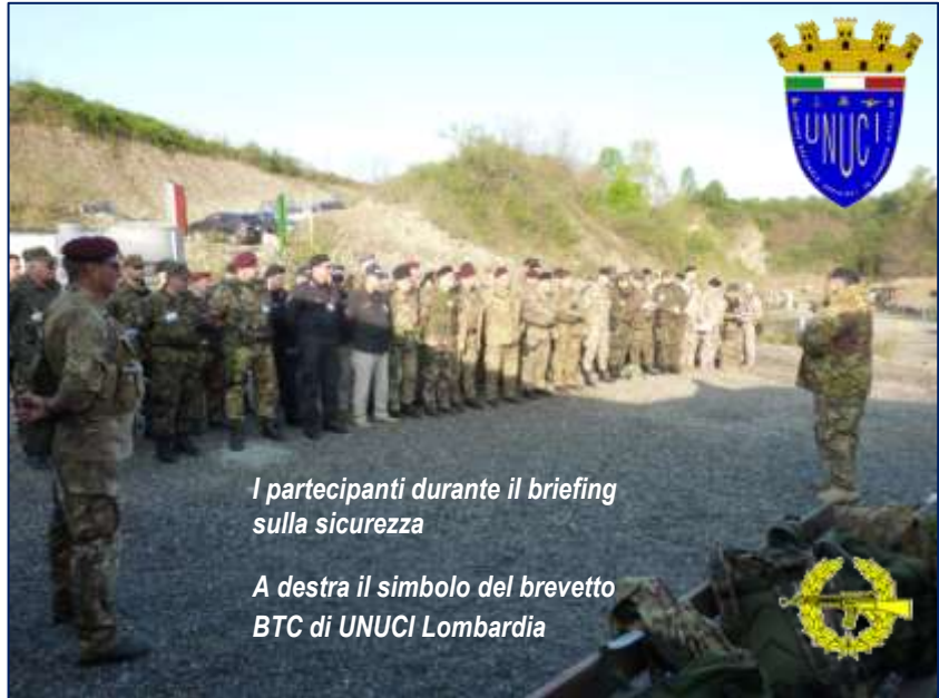
I partecipanti durante il briefing sulla sicurezza

Oggi l'Unione è investita direttamente dallo Stato Maggiore della Difesa del compito di interfacciarsi con il personale della Riserva Selezionata e delle Forze di Completamento, siano essi ufficiali, sottufficiali o militari di truppa. In conseguenza, questo impegno, profuso nell'organizzazione di attività mirate al raggiungimento e mantenimento di alti standard addestrativi nel settore del tiro operativo militare, acquista sempre maggior valenza.